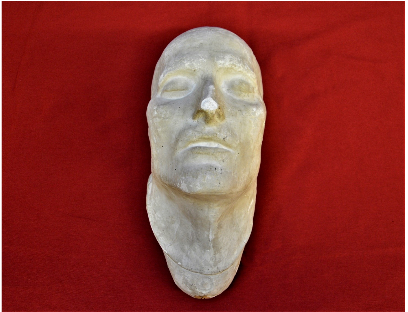
Figura 7: Calco in gesso della Maschera Funeraria di Napoleone Bonaparte del tipo "Antommarchi 1833". Il calco riproduce le fattezze di Napoleone sul letto di morte a Sant'Elena nel 1821. La firma visibile alla base del collo è quella di Francesco Antommarchi, medico italiano inviato sull'isola dalla madre del Bonaparte, che non si fidava dei medici inglesi. Antommarchi si rende presto conto di potere trarre profitto dalla morte dell'ex Imperatore, e realizza a Sant'Elena, pochi giorni dopo il 5 maggio, alcuni calchi in gesso del viso del defunto. Anni dopo, nel 1833, l'esperimento si trasforma in una operazione di tipo commerciale visto l'interesse per il cimelio. Antommarchi realizza e mette in vendita numerose copie apponendo firma e sigillo a garanzia antifalsificazione.