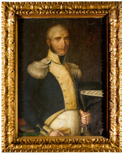
Figura 6: “Antonio Onofri”, dipinto a olio su tela del pittore Pietro Tonnini, XIX secolo. Musei di Stato RSM

la dignità di Stato, mantenendo l'estensione territoriale che aveva prima delle campagne napoleoniche.