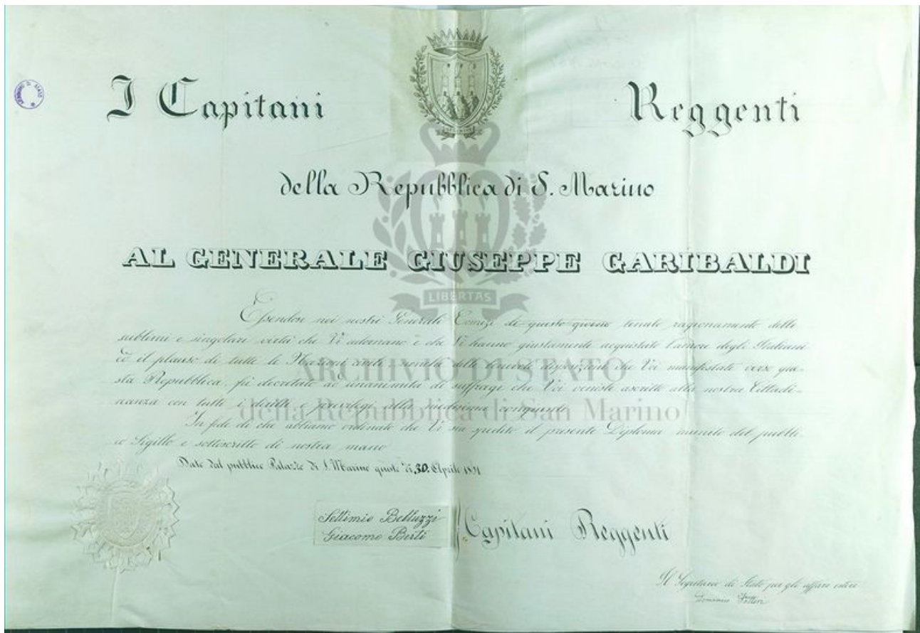
Figura 1: Diploma di conferimento della cittadinanza sammarinese al Generale Giuseppe Garibaldi. Archivio di Stato RSM, b. 179, Carteggio, Lettere alla Repubblica

Quella con Napoleone Bonaparte invece è una storia diversa ma legata alla figura di Garibaldi perché si tratta di un altro generale.